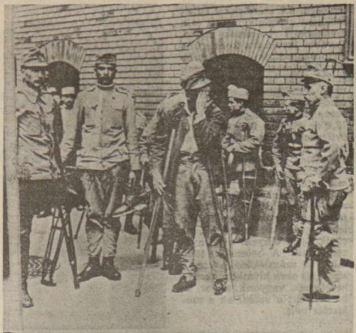
Mindent megfontoltak és megfontoltak

zonyithatta valódi életképességét, és máris újabb háború pusztította Európát, majdnem pontosan 25 évvel az első világháború kitörése után. És az sokkal pusztítóbb volt, sokkal több emberéletet követelt, és sokkal többet az ártatlan és védtelen polgári lakosságból. Új status quo alakult ki, egyebek közt az egykori monarchia egykori területén is. Csak egyvalami nem tudott kialakulni a valaha egységes és mégis rendkívül sokféle közép-európai térségben: egy olyan integráció, amelyben az egymás szomszédságában élő és végül is egymásra szoruló kis népek mindegyike kölcsönösen jól járna.